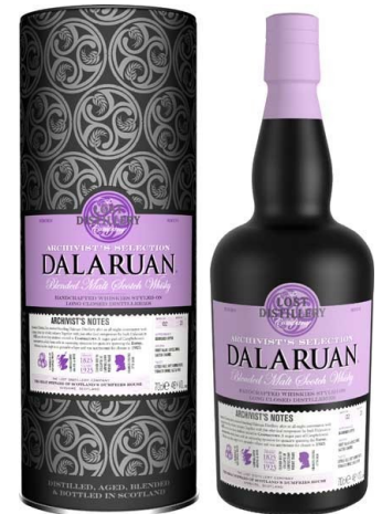
Richtpreis CHF 99.00