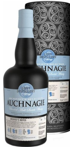
Richtpreis CHF 99.00